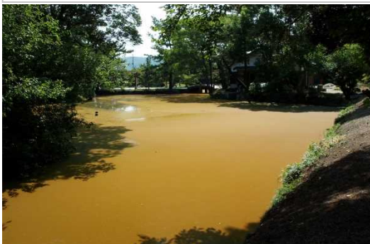
汚水 3333 坪浄化前 体と汚水は同調

細胞はコンピューターと同じ電子構成。認知症は食の酸化で血液が汚れ記憶を司る脳幹海馬通電が 悪く成り…過去の記憶遮断される【認知症・痴呆】脳の血汚れと生体電子不足。蘇る水は切れた 電球が点灯する蘇生電子含み…脳の血液浄化。脳細胞を電子活性。細胞返若返る類の無い技術です